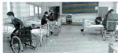
【ここからからだの理解】 「ここ」と「からだ」のしくみについて学んだ上で、正確な知識にもづく介護が提供できる専門職を目指します。