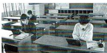
【地理B】 デジタル&アナログ両教材を使って、世界を旅しています。(2年次自然科学系列)