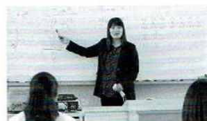
【ハンダ】 姜先生による丁寧で分かりやすい授業を通して、基礎を磨いています。