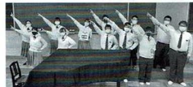
【コーラス部】 部員13人(男子7人、女子6人)で毎日楽しく混声合唱をしています。