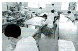
【クラフトデザイン】 クラフトデザインでは、選択者7名で、様々な材料を元に立体作品を制作しています。身近で活用することのできるものを作ります。