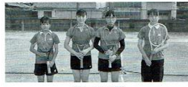
【テニス部女子】 部員は3年生2人、1年生2人、計4名です。県大会出場を目標に頑張っています。