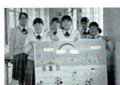
【ボランティア部】 グループホームに持っていく壁面構成を毎月作成しています。