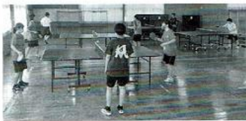
【卓球部】 「卓球を楽しむ」をモットーに、日々練習に励んでいます。部員それぞれの個性に応じたレベルアップを目指しています。