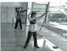
【弓道部】 部員15名で、互いに助け合って楽しく活動しています。