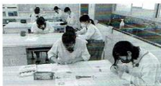
【子どもの発達と保育】 保育技術検定の練習風景です。保育士に必要な技術の習得が目標です。