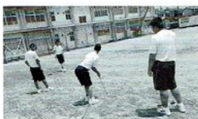
【レクリエーション】3年次T2群 バットゴルフ…毎回、工夫を凝らしてコースを作っています！