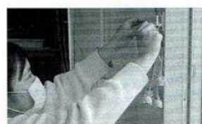
【総合研究 生物】 総合研究生物講座では、研究計画を立て、研究計画発表会を行い、実験をスタートさせました。