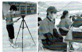
【報道部】 5月25日に行われたリレコーニバルで、アナウンス、ビデオ撮影と頑張りました。