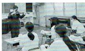
【音楽Ⅱ】 見て、触れて、体験して、楽しく音楽を学んでいます。キマってる！