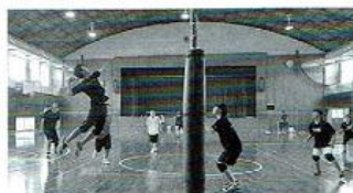
【バレーボール部】 男女合同で、ゲーム形式の練習に日々励んでいます。