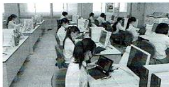
【総合研究 マルチメディア】 本年度導入された一人一台のタブレットも活用し、有意義な研究が進められています。調べたりまとめるという2時間があってという間です。