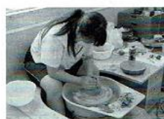
【美術・工芸部】 部員24名で、絵画・デザイン・焼き物・木材工芸など、それぞれの興味ある分野の作品制作に日々取り組んでいます。