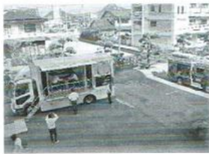
文化祭での起震車体験