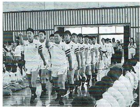
当時の壮行会写真

卒業後は、明治大学に進学しました。早明戦に出場し観客四万人の前でプレーしている姿を、家族や当時のラグビー部顧問の先生に見せることができたことは、今でも私の誇りです。明治大学卒業後は、三重県鈴鹿市を拠点としている「三重 FoudaHEAT」でラグビーを続けています。一年、一年が勝負の年であり、League One という日本最高峰のリーグでプレーできているという喜びをかみしめています。現在は Division2 にいますが、五月に開催される入れ替え戦に勝利し Division1 に昇格することを目標としています。北条高校ラグビー部に恥じない戦いをしたいと思いますので応援よろしくお願います！