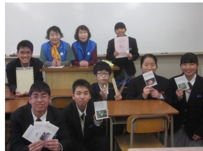
《 点字作品を持って集合写真を撮りました 》