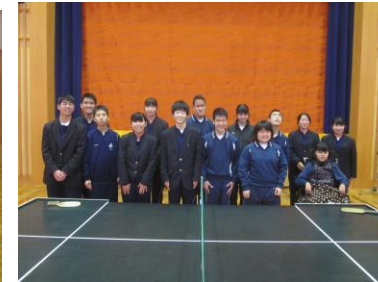
《 最後は笑顔で集合写真 》