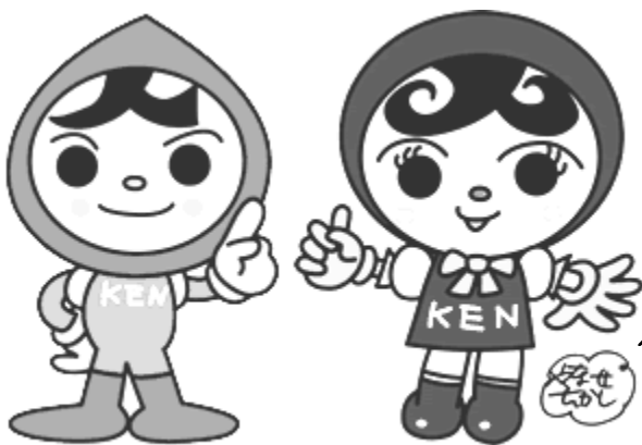
人権イメージキャラクター 人KENまもる君・人KENあゆみちゃん

「障がい者週間」の期間を中心に、国、地方公共団体、関係団体等においては、さまざまな意識啓発に係る取り組みを展開しています。